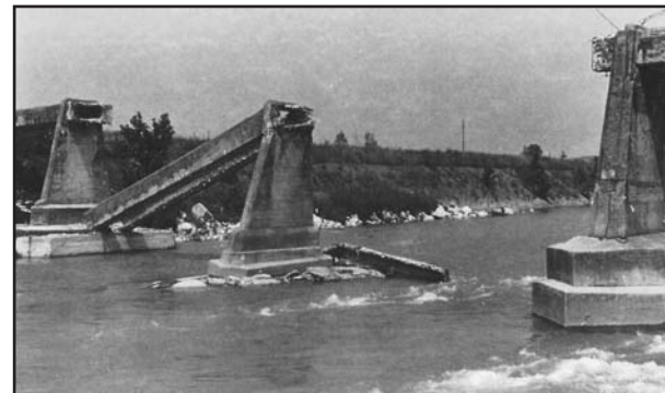
Il vaso "Canalone" che attraversa il fiume Chiese presso Borgosotto, distrutto dalla grande piena il 3 ottobre 1976.