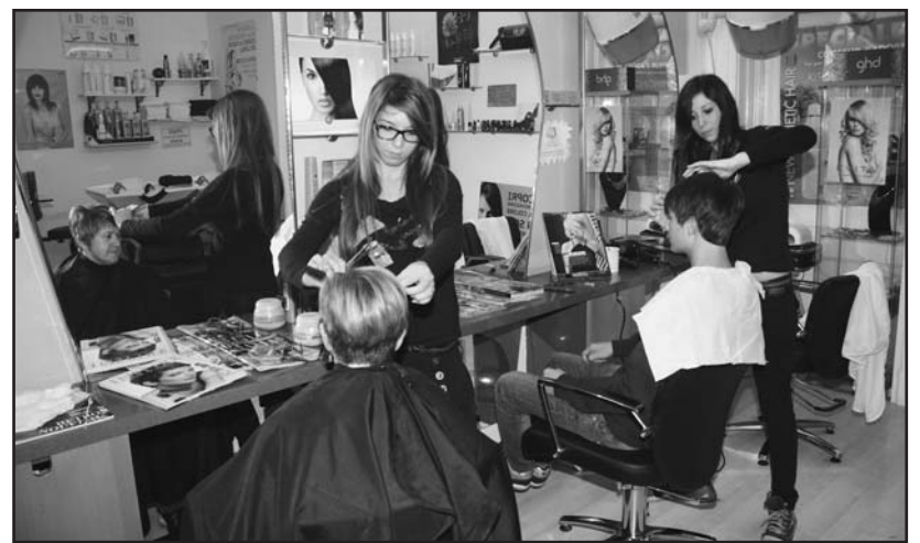
Taglio di capelli donna e uomo.

Chiari il messaggio con prezzi concorrenziali, sconti speciali, dove lui e lei trovano tutti i servizi tradizionali, taglio ed acconciature a secondo le esigenze della clientela con prodotti adatti da usare personalmente. Orari di apertura: lunedì, martedì, mercoledì, giovedì, dalle ore 9 alle ore 18,30. Venerdì e sabato dalle ore 9 alle ore 19,30. La linea Coiffeur J'Adore è presente anche a Carpenedolo e paesi limitrofi.