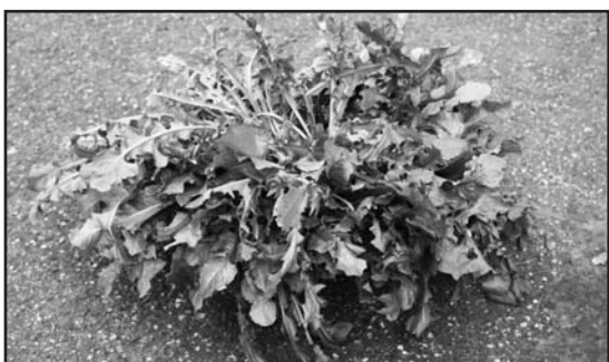
La buona verdura di campo.

Gli sgrégn, per chi non lo sappia, sono una variante della cicoria, un po' più amari, ma molto saporiti. Anni fa erano la verdura principe dell'inverno: le donne andavano per campi a raccogliarla, dunque non costava, e accompagnava le misere pietanze soprattutto serali: una minestra e un po' di sgrégn con