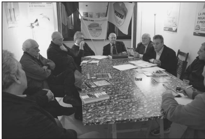
La presentazione alla stampa nella sede dell'IDV.