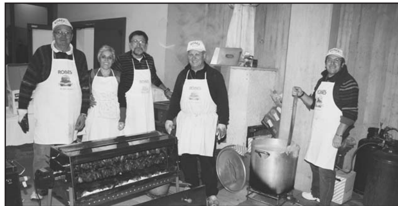
I cuochi della serata.

La serata si è svolta presso i locali del Centro Giovanile e nel salone principale vi erano circa trecento persone (sessanta porzioni prenotate per casa) che sono state servite da diversi volontari a loro volta partecipi dell'adesione. Una lotteria interna ha contribuito alla raccolta dei fondi per ulteriori ne-