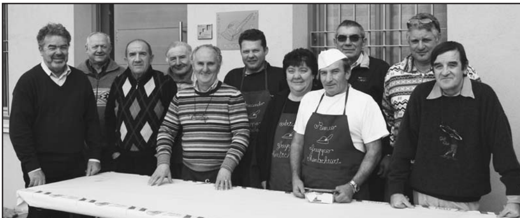
Gli organizzatori della manifestazione.